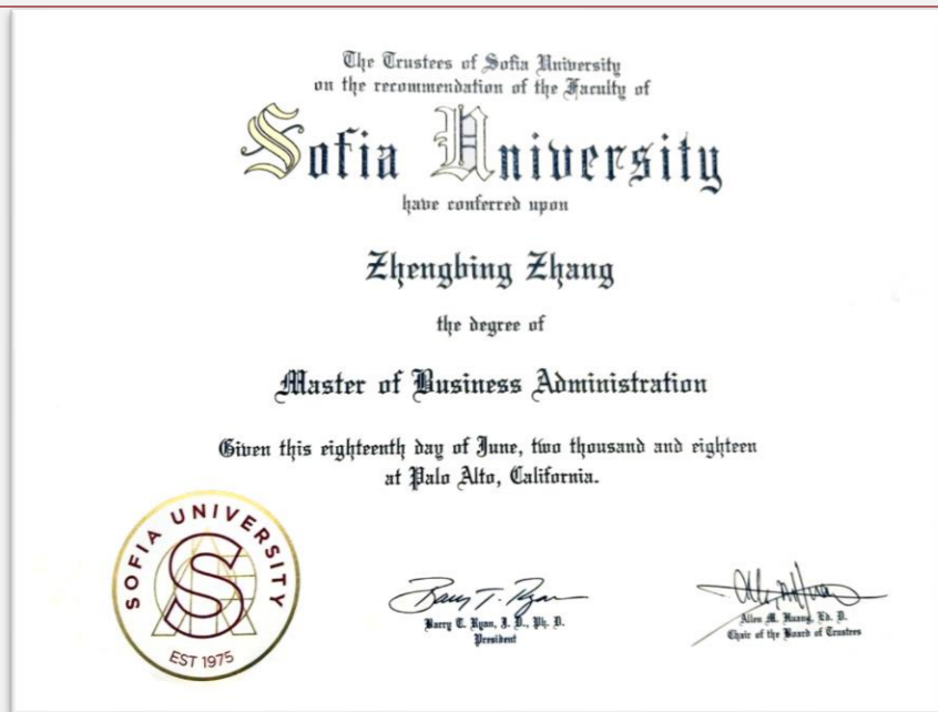
美国索菲亚大学MBA学位证书 全球通行，与在校生相同

满足毕业条件的学员将获得美国索菲亚大学授予的 美国索菲亚大学MBA学位证书和紫荆教育的结业证书