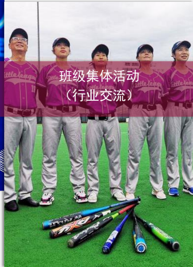
班级集体活动 (行业交流)