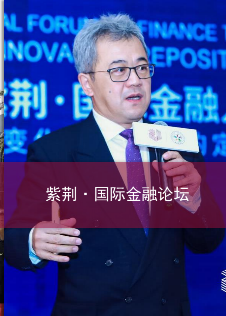
紫荆·国际金融论坛