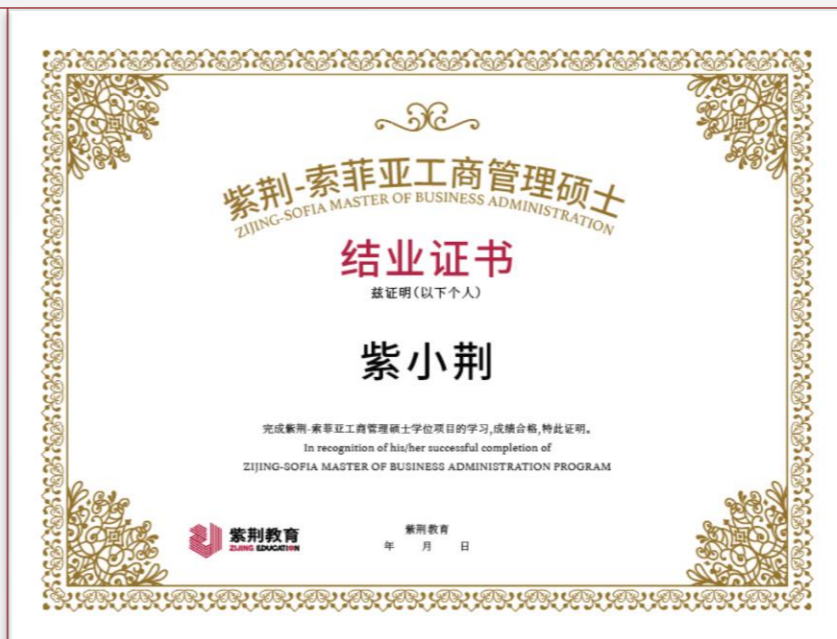
紫荆教育结业证书 官网可查、对学习经历的记录和证明

满足毕业条件的学员将获得美国索菲亚大学授予的 美国索菲亚大学MBA学位证书和紫荆教育的结业证书